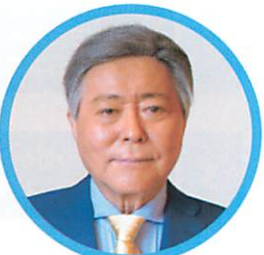
タレント 小倉 智昭さん

8歳のときに1型糖尿病を発症。「1型糖尿病でも何にでも挑戦できる」をモットーに、4歳から始めたエアロビックでは2002年、2003年にジュニアの世界チャンピオンになる。引退後は元日本代表選手として教育機関や各種イベント等での講演や実演、運動指導などを行っている。