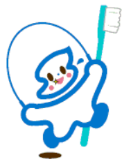
歯や口の健康普及マーク 「ハッピー」

文部科学省の学校保健統計調査（平成28年度）によると、新潟県の12歳児の一人平均むし歯数は全国最少で、17年連続日本一を達成しました。